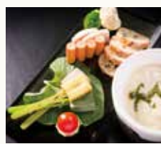
吟香チーズフォンデュ Sake and miso flavored cheese fondue