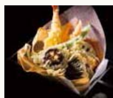
天麩羅8種 Assorted 8 kinds of Tempura