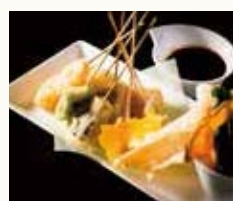
串揚げ8種 Assorted 8 kinds of Skewers