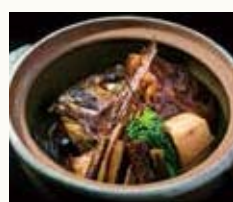
真鯛の荒炊き Simmered red sea bream