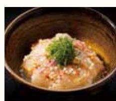
鯛の胡麻味噌茶漬け Rice and sesame flavored sea bream served with Japanese broth