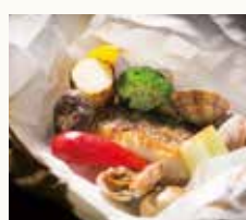
白身魚 浅利と 野菜の奉書焼き White fish, asari clam and vegetables wrapped in paper