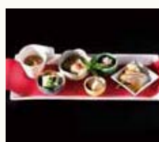
2016レッドカーペット 2016 Red Carpet