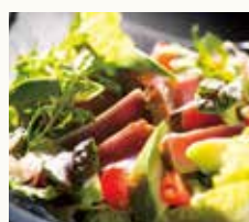
炙り鮪とアボカドの シーザーサラダ Caesar salad with seared tuna and avocado