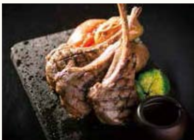
ラムチョップ Lamb Chop