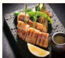
厚切りベーコンの炙り 味噌風味 Grilled bacon slab with miso flavor