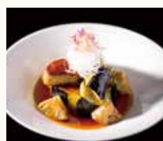
フォアグラと丸茄子の グリル 餡かけ Grilled foie gras and eggplant with thick starchy sauce