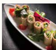
生湯葉とスモーク サーモンの生春巻き Soy milk skin and smoked salmon summer roll