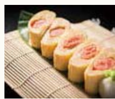
明太出し巻き Rolled egg with seasoned cod roe