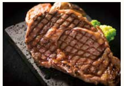
US プライム ハネシタ US Prime chuck flap