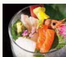
本日の刺身5種 5 kinds of Sashimi of the day