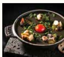
さざえのアヒージョ Turban shell ajillo