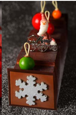
ブッシュ・ド・ノエル キャラメルノア ¥6,000