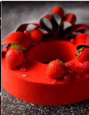
クリスマスリースルージュ ¥5,500