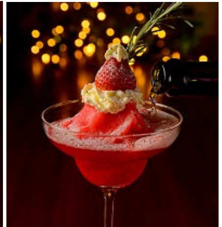
ホーリーナイト＜フローズンストロベリー＞