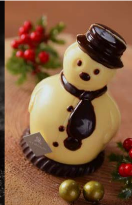
スノーマンチョコレート ¥950