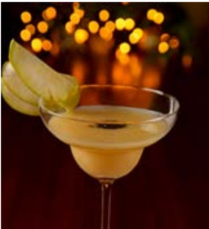
ノエル＜洋梨のカクテル＞

仕上げに注ぐシャンパンが苺とベストマッチな、クリスマスにぴったりの可愛いカクテル。