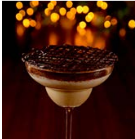
ナターレ＜ティラミスマティーニ＞