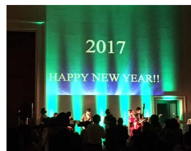
昨年のカウントダウンパーティーの様子

販売期間： 2017年12月31日まで 宿泊期間： 2017年12月31日 チェックイン限定 料金： 2名様ご1室 112,000円～ 内容： ニューイヤーカウントダウンイベントチケット付き、 レイトチェックアウト13時