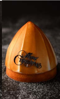
クリスマスモンブラン ¥3,800