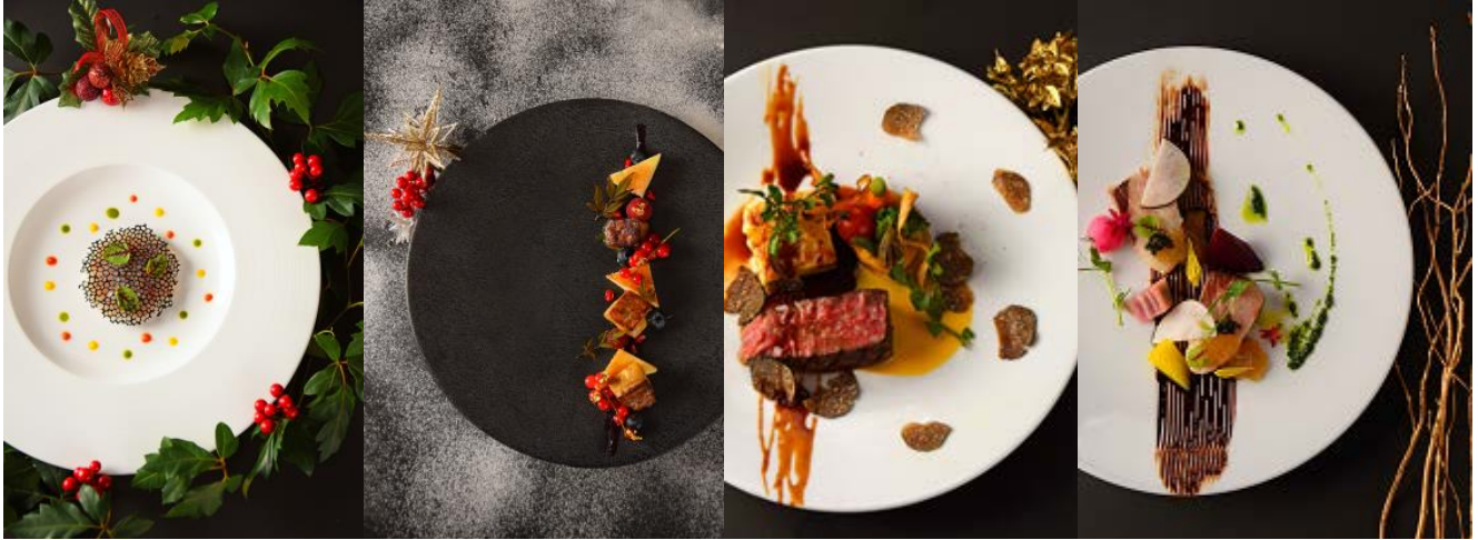
「ラベデュータ」 スカンビのタルタル