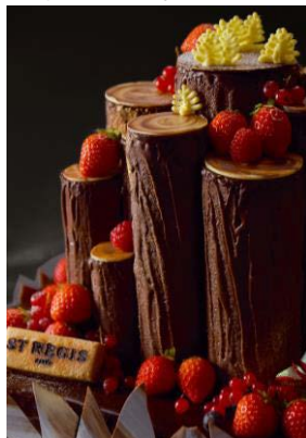
スペシャル ブッシュ・ド・ノエル ¥35,000 (予約注文限定)