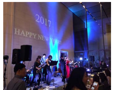
昨年のカウントダウン JAZZ パーティーの様子