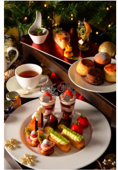
クリスマスアフタヌーンティーセット