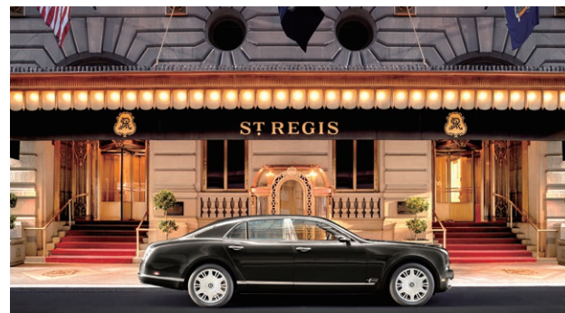
セントレジスニューヨークは今なお設立された1904年当時の面影を残し、ニューヨーク市指定のランドマークとしても親しまれています。映画「ブラダを着た悪魔」のロケ地にも!

The St. Regis New York redefines luxury in the heart of NYC. Its stately address at 5th avenue has seen eras of glamour in the heart of midtown Manhattan. Just like its founding hotel, The St. Regis Osaka sits in the famed Midosuji street and is the choice of discerning travelers.