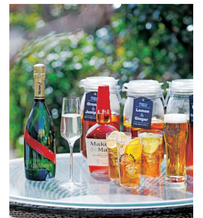
シャンパン、ビールにクわえ、今年はハイボールが豊富に登場。レモンやライムなど様々なフレーバーをお楽しみください。

Venture to The St. Regis Osaka's rooftop terrace and you will be greeted by soaring views of the city while you sip on Champagne in the evenings. Savor moreish bites inspired by the trendy eats in New York, like the Tornado Potato and sirloin steak, so fancy that they will warrant a photo for social media. Imbibe wide ranges of beverages loved by New Yorkers, including Mumm Champagnes and Maker's Mark craft highball. If you've never been to Manhattan, NY Champagne Garden is the place to be to soak in the atmosphere and energy of this industrious city.