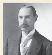
A born inventor and notorious rule-breaker, John Jacob Astor IV founded The St. Regis New York as a place to pursue his passions in the company of the city's luminaries. More than a century later, the St. Regis brand is renowned for its tradition of innovation and commitment to impeccable service at the best addresses around the world.

作家で発明家であったアスター脚は、NYの偉人たちとともに情熱を追求する場としてセントレジスニューヨークを設立。後にタイタニック号の沈没で帰らぬ人に。華やかな激動の時代を駆け抜けました。