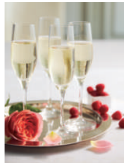
先着10~20名様限定 limited to first 10-20 guests

シャンパンボトルの口を専用サーベルで切り飛ばして開ける儀式、サーベラージュ。シャンパンをこよなく愛したフランス皇帝ナポレオンが、戦の験かつぎや将校たちの士気を高めるために始めたと言われていました。セントレジスホテル大阪では一日を無事に終え、夜を迎えることを祝ってサーベラージュを夕刻のテラスで開催いたします。豪快で華やかな幕開けの儀式とともに、期待が膨らむ素敵な夜の始まりに、シャンパンで乾杯を。